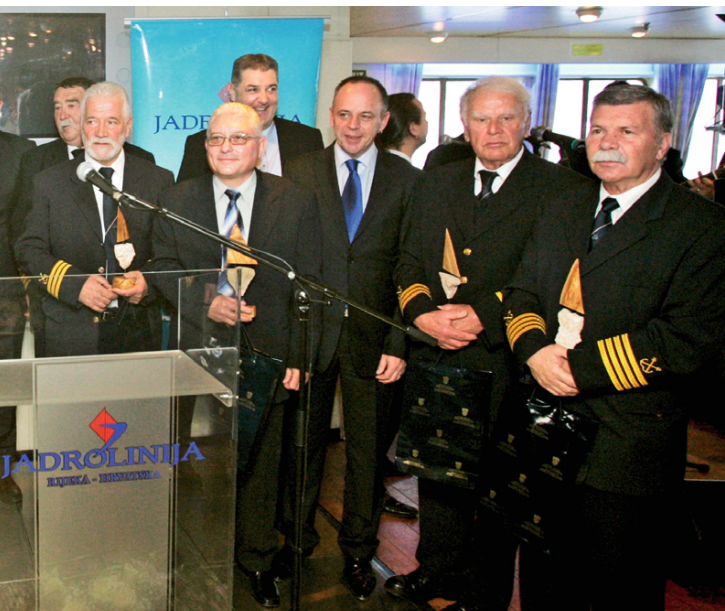
čerašnjem druženju u povodu Svetoga Nikole