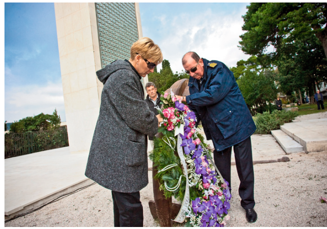
Polaganje vijenaca za poginule pomorce

Svjetionik je upaljen 1953. godine, ranjen u Domovinskom ratu 1991. i obnovljen 2013. godine, s 5792 nove staklene prizme, pa 'ukrašen' vijencima jučer, na blagdan pomoraca